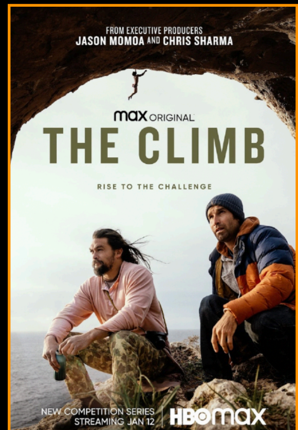
The Climb HBO MAX