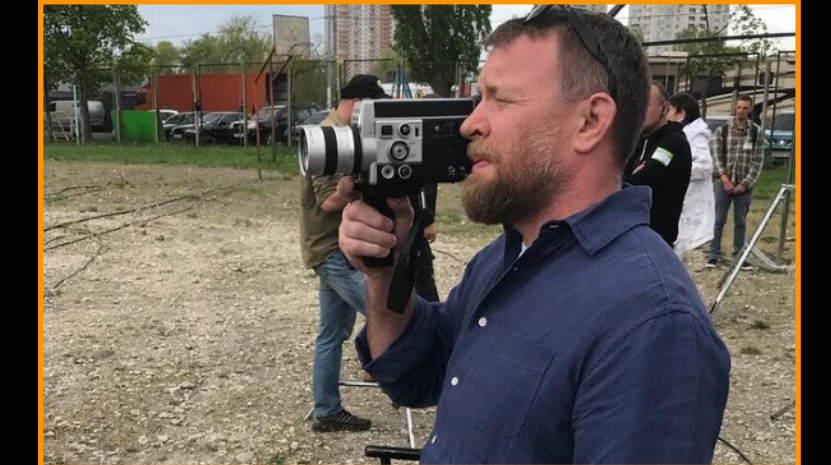
The Interpreter; Guy Ritchie