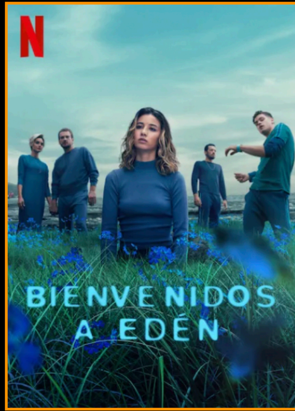
Bienvenidos a Edén NETFLIX