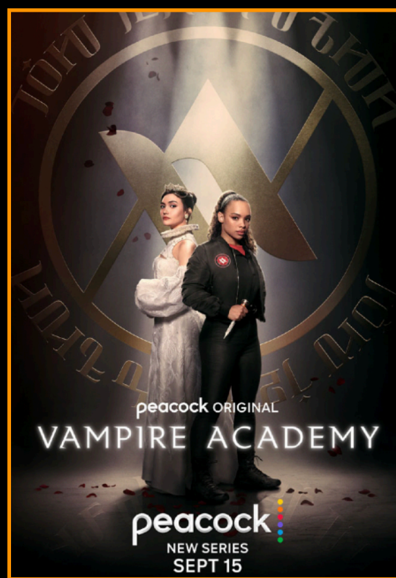
Vampire Academy PEACOCK