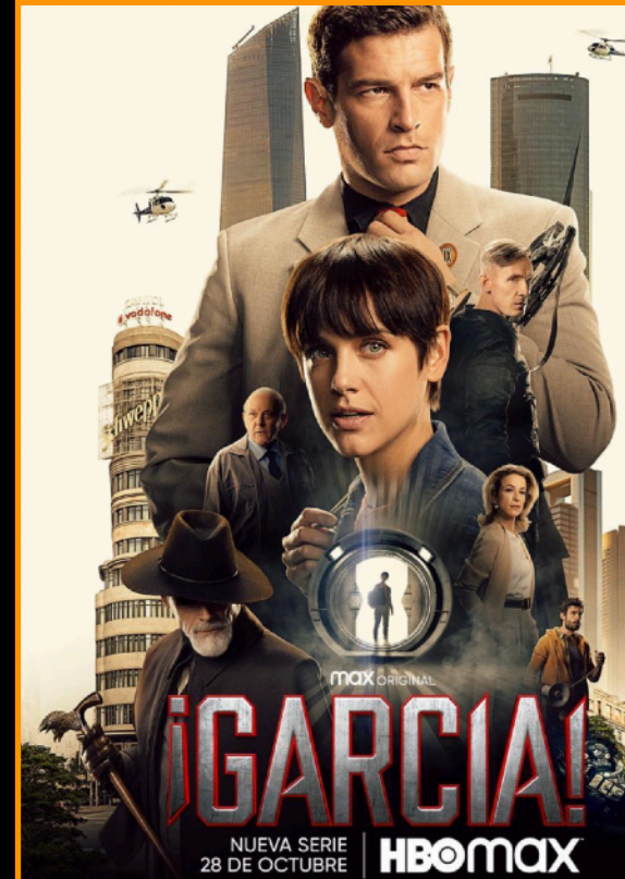
¡García! HBO MAX